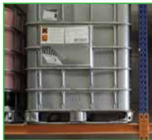
Ambalažu treba pravilno odlagati da bi ne bi došlo do izlivanja sadržaja