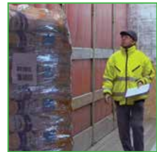
Osoblje koje radi u objektima za tretiranje semena i u skladištima treba da pregleda transportna vozila i da se pobrine da je tovar adekvatno osiguran