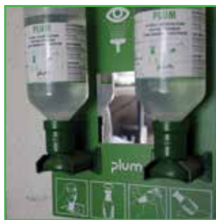
Tuševi za oči treba da budu lako dostupni u radnim zonama objekata za tretiranje semena