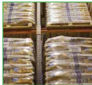
Čvrsto naslagane i obmotane vreće sa semenom smanjuju rizik od oštećenja na vrećama i smanjuju količinu prašine