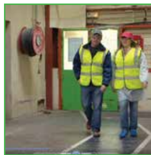
Posetioce objekta za tretiranje semena treba da nose odgovarajuća lična zaštitna sredstva