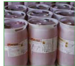
Pažljivim pomeranjem ambalaže u kojoj se nalaze sredstva za tretiranje semena smanjuje se rizik od eventualnog izlivanja

Uvek treba postupati u skladu sa lokalnim zakonima i propisima i njima prilagođavati preporuke iz ovog Priručnika, ako za to postoji potreba. Za odgovore na pitanja, stupite u vezu sa predstavnikom Syngente sa kojim saradujete