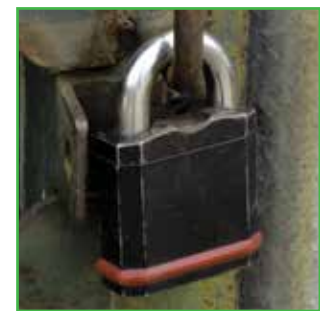
Treba sprovesti mere za kontrolu pristupa čime se smanjuje rizik da će osoblje i posetioći biti izloženi opasnosti

Uvek treba postupati u skladu sa lokalnim zakonima i propisima i njima prilagođavati preporuke iz ovog Priručnika, ako za to postoji potreba. Za odgovore na pitanja, stupite u vezu sa predstavnikom Syngente sa kojim saradujete