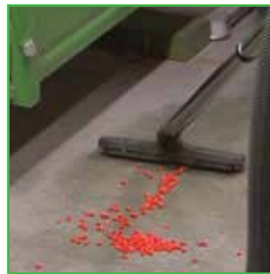
U slučaju izlivanja, tretirano seme treba sakupljati usisivačima sa HEPA* filterima, a tečne materije treba čistiti adsorbensima