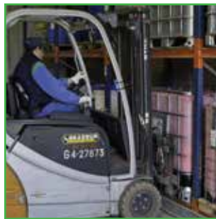
Viljuškare treba voziti pažljivo da ne bi došlo do prosipanja